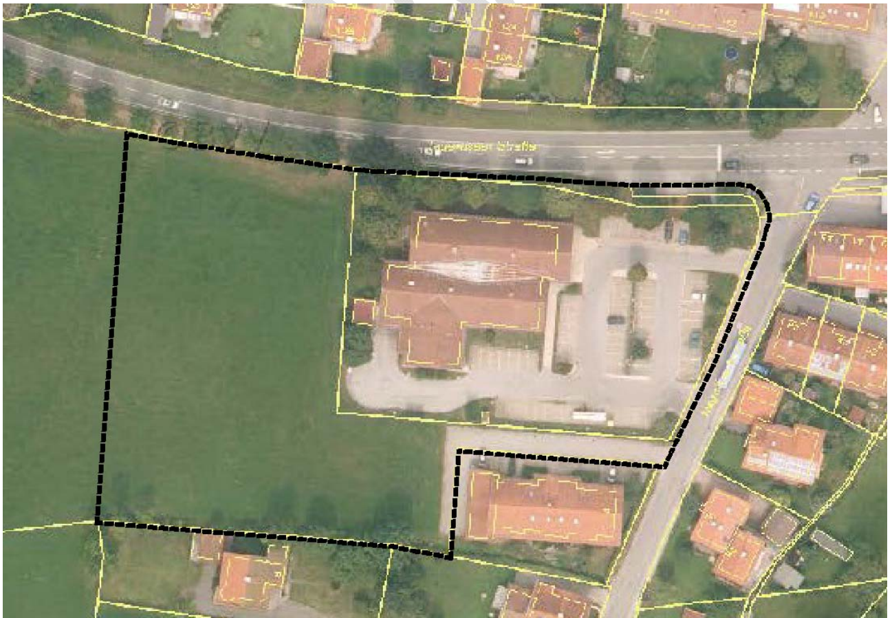
Abbildung 1 Luftaufnahmen der Altnutzung mit neuem Geltungsbereich

Das am Ortsrand liegende Gebiet des Bebauungsplans Nr. 14 liegt im westlichen Gemeindebereich der Gemeinde Hausham und ist im nordöstlichen Bereich derzeit mit Gebäuden (Lebensmittelmarkt) und zugehöriger Parkplatzanlage bebaut.