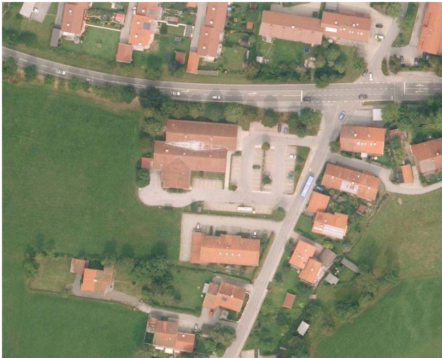
Abbildung 3 Luftaufnahmen der Altnutzung

Im Süden, Norden sowie Osten befinden sich Wohn- bzw. Mischgebietsnutzungen.