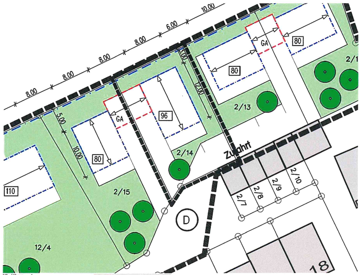
Auszug aus der rechtsverbindlichen 3. Änderung

Der Geltungsbereich der Änderung begrenzt sich räumlich auf die Flurnummer 2/14, Gemarkung Hausham und ist zeichnerisch dargestellt.