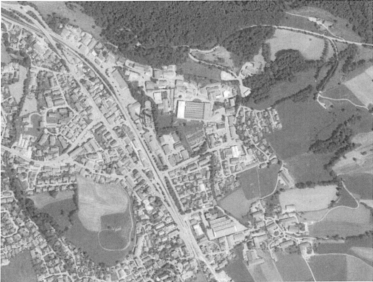
Abbildung 1: Gemeindegebiet Hausham für den betroffenen Bereich

Das Plangebiet liegt im südlichen Gemeindegebiet von Hausham östlich der Bundesstraße 307 – Miesbach Richtung Schliersee. In einer Entfernung von ca. 2 km (Luftlinie) zum Bebauungsplangebiet befindet sich das Krankenhaus Agatharied GmbH.