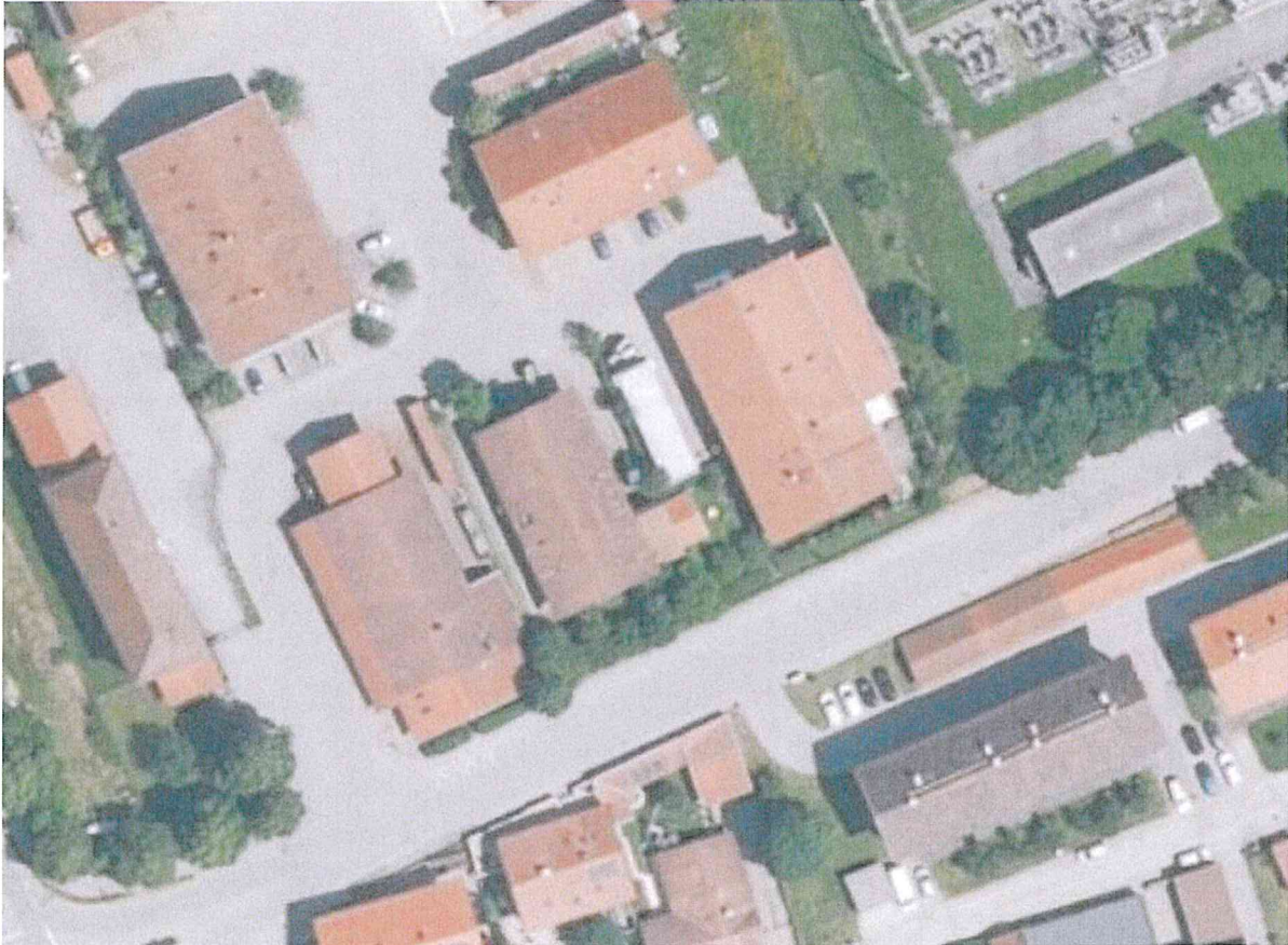
Abbildung 2: Gemeindegebiet Hausham für den betroffenen Bereich

Der Geltungsbereich umfasst die Grundstücke der Fl.Nrn.: 1353/83; 1353/85, 1353/86; 1353/87; 1353/88; 1353/90; 1353/92; 1353/93 sowie 1353/94 der Gemarkung Hausham und weist eine Fläche von insgesamt 1,33 ha auf. Da es sich hier um die 3. Änderung des Ursprünglichen Bebauungsplanes Nr. 10 „Ehemaliges Kraftwerksgelände“ handelt, liegt der Geltungsbereich auch weiterhin in einem Gewerbegebiet.