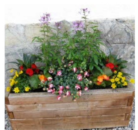
Bei den Gedenktafeln für Bergleute