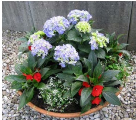
Bergleute – Denkmal am Rathaus