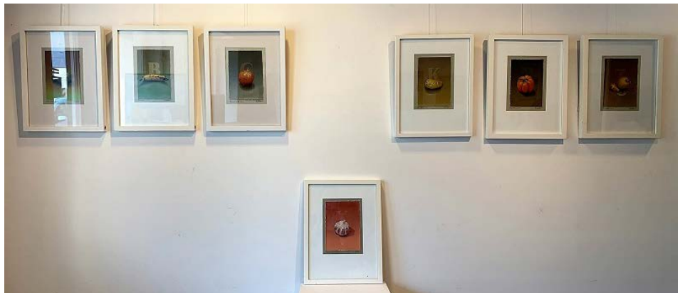
Rudi Leitner setzte seine Motive in sehr realistischer Darstellungsweise um.