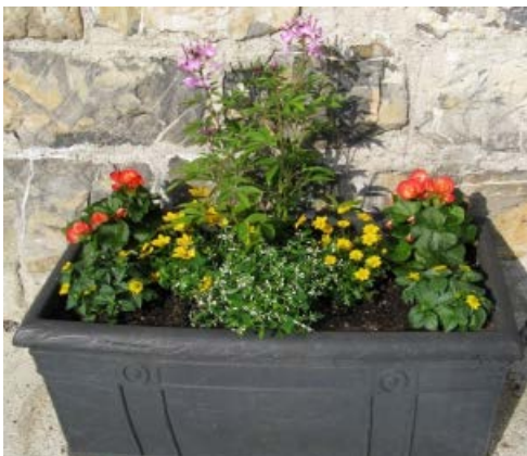
Kleiner Trog vor der Kirche

Bei der Jahreshauptversammlung im März im Gasthaus „Staudenhäusl“ fand nach den Corona-Jahren die Neuwahl statt. Die bisherige Vorsitzende führt den Verein letztmalig nochmals 4 Jahre und sucht somit eine Nachfolgerin bzw. Nachfolger.