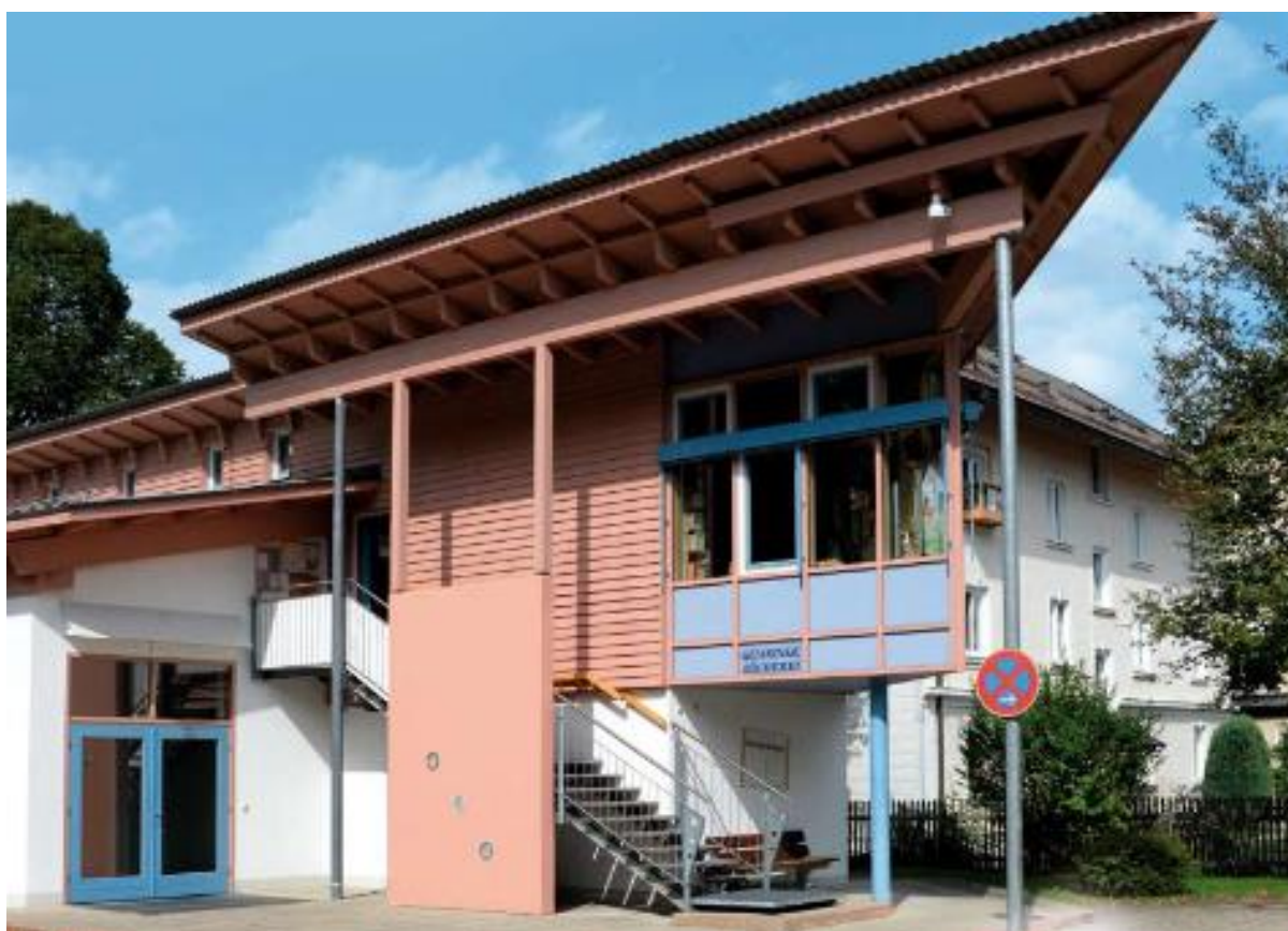
Bürgeraal – mit Gemeindebücherei Hausham

Kinder und Jugendliche bis zum 18. Lebensjahr sowie Schulen und Kindergärten entleihen weiterhin gebührenfrei.